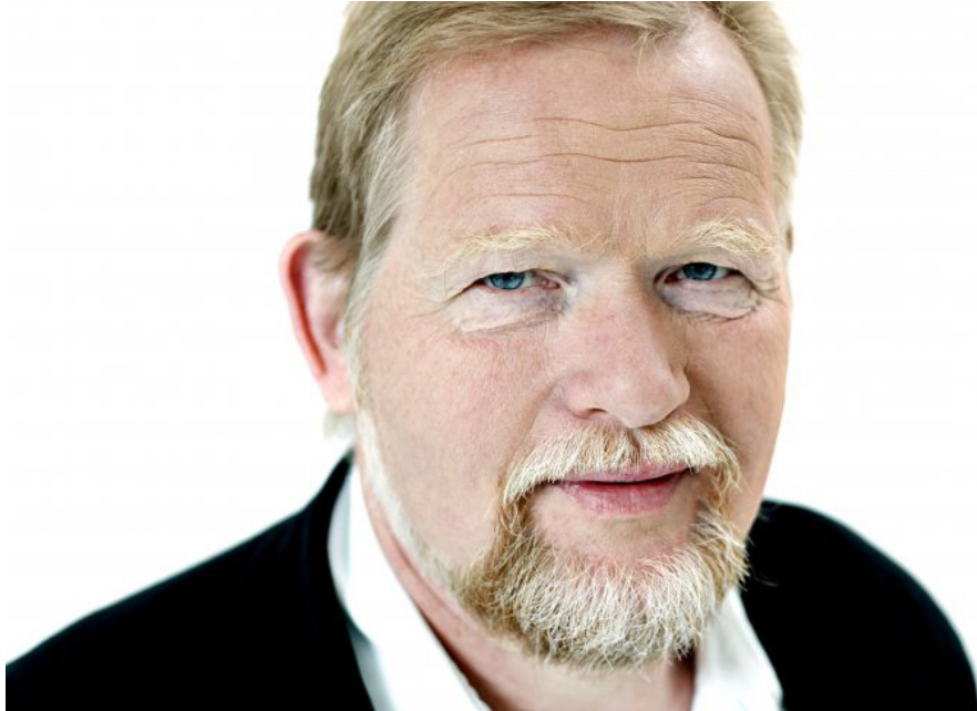
Folketingsrepresentant: Christian Juhl.