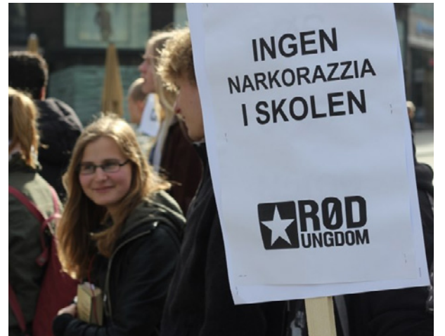
Aksjon: Rød Ungdom aksjonerte mot narkorazziaer i skolen.

– Hennes & Mauritz har enda ikke tatt advarselen til seg, så fra 21. mai til 10. juni skal aktivister fra Rød Ungdom merke retusjert reklame over hele landet. Vil du bli med? Send en mail til motretusjering@gmail.com .