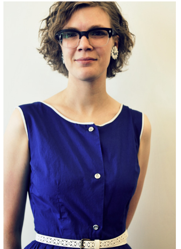
Nestleder i Rødt: Marie Sneve Martinussen.

– Staten er stadig den største eieren i Telenor. I