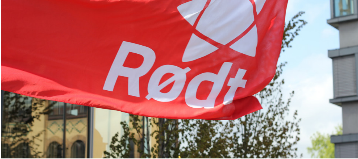
I vekst: Rødt er et parti med store ambisjoner.