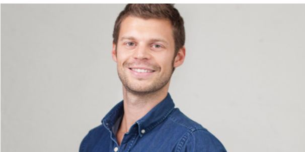
OL-motstander: Bjørnar Moxnes.