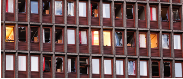
22. juli: Regjeringskvartalet.