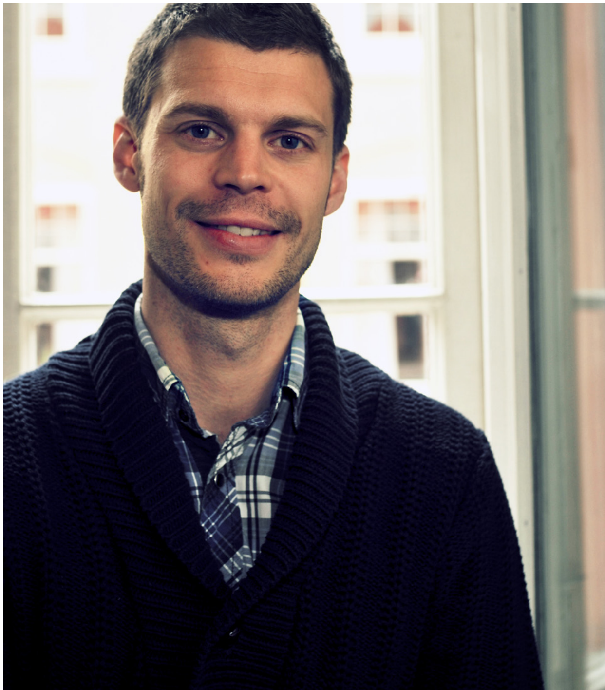
Ny Rødt-leder: Bjørnar Moxnes.

mange ønsker at Norge skal ha en mer uavhengig stemme i verden og at det norske forsvaret ikke skal opptre som en leiehær for amerikanernes såkalte interesser.